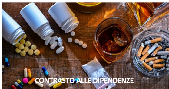
CONTRASTO ALLE DIPENDENZE

Percorsi integrati per l'inclusione sociale e lavorativa di giovani e adulti con dipendenze patologiche