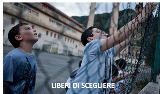
LIBERI DI SCEGLIERE

Percorsi per favorire la scelta di giovani provenienti da contesti mafiosi di abbandonare la famiglia e tale contesti