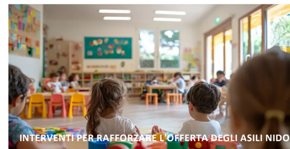
INTERVENTI PER RAFFORZARE L'OFFERTA DEGLI ASILI NIDO

Misure economiche per l'abbattimento delle rette agli asili nido e partecipazione alle attività extrascolastiche